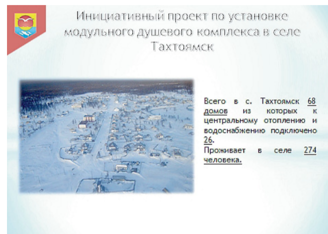
Инициативный проект по установке модульного душевого комплекса в селе Тахтоямск

Общий объём 784 куб.м. на общую сумму 872,62 тыс. руб.