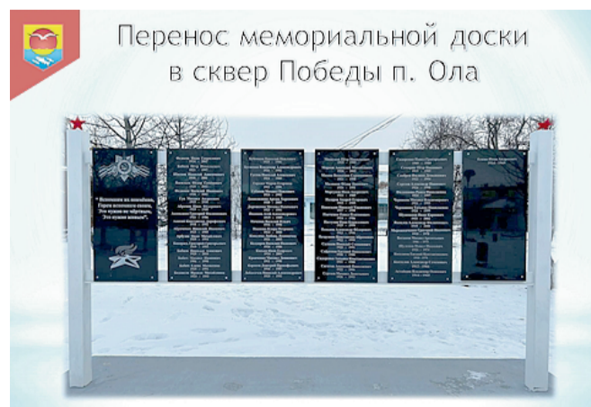
Перенос мемориальной доски в сквер Победы п. Ола