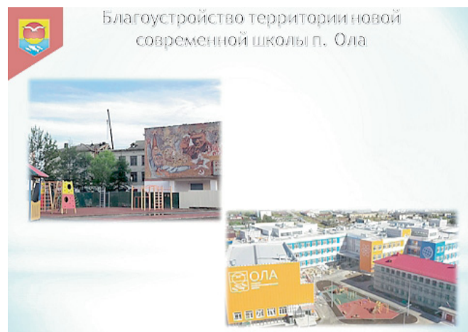
Благоустройство территории новой современной школы п. Ола