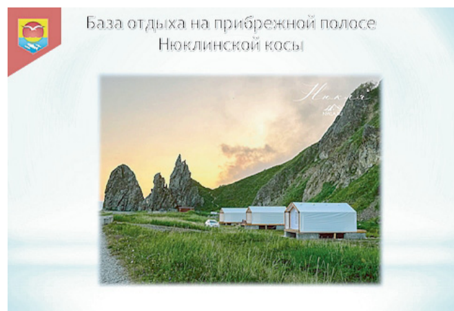
База отдыха на прибрежной полосе Нюклинской косы