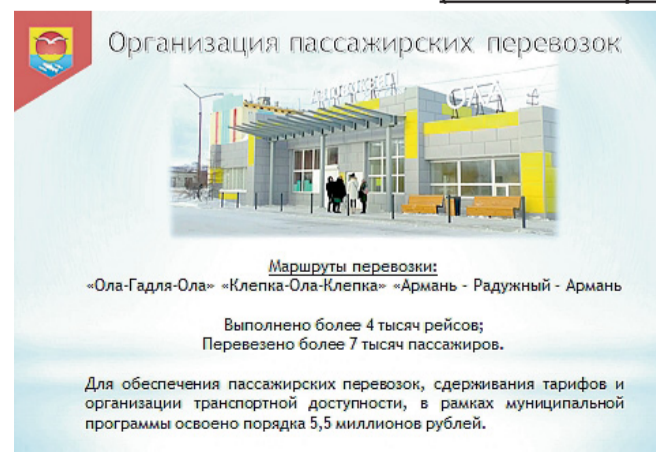
Организация пассажирских перевозок

Маршруты перевозки: «Ола-Гадля-Ола» «Клёпка-Ола-Клёпка» «Армань - Радужный - Армань»