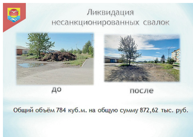
Ликвидация несанкционированных свалок

Общий объём 784 куб.м. на общую сумму 872,62 тыс. руб.