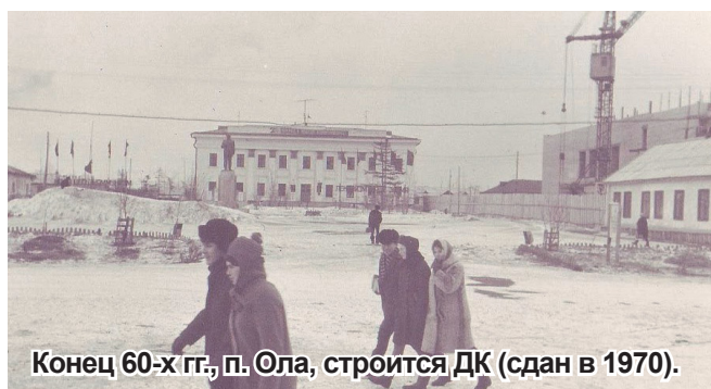
Конец 60-х гг., п. Ола, строится ДК (сдан в 1970).