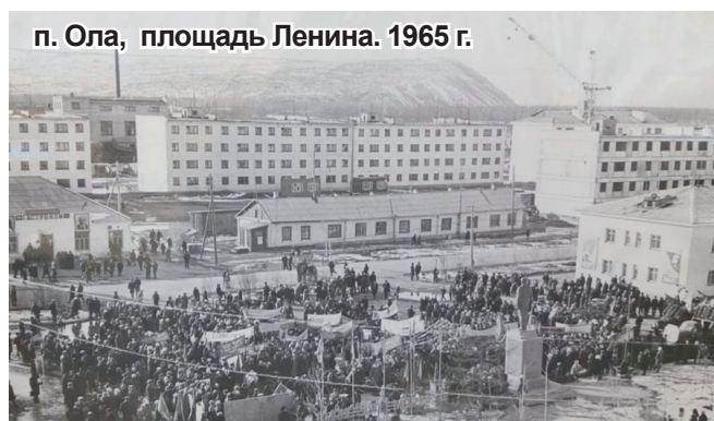
п. Ола, площадь Ленина. 1965 г.