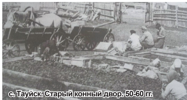
с. Тауйск. Старый конный двор. 50-60 гг.