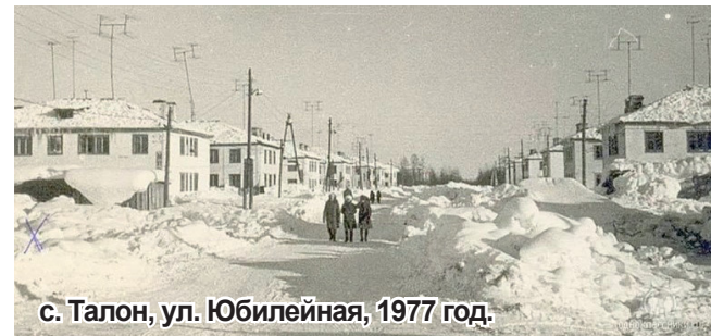
с. Талон, ул. Юбилейная, 1977 год.