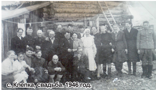
с. Клепка, свадьба. 1946 год.