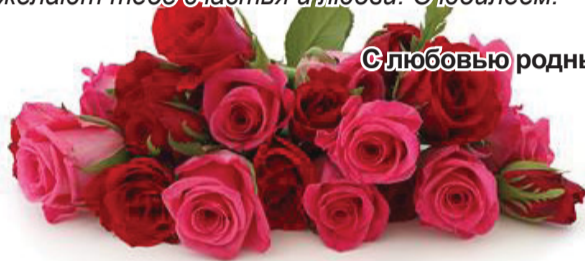
С любовью родные.

Пусть твоя жизнь всегда будет полна ярких красок, чудесных впечатлений, позитива, красивых чувств и эмоций. Пусть рядом будут только хорошие, добрые люди, близкие и друзья. И пусть все звёзды и небесные светила, глядя сегодня с небес на твой великолепный праздник, так же, как и мы, пожелают тебе счастья и любви. С юбилеем!