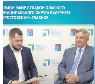
Прямой эфир с главой Ольского муниципального округа Валерием Форостовским: главное

29 марта 2023 года Центр управления регионом провел онлайн-беседу с главой Ольского муниципального округа Валерием Олеговичем ФОРОСТОВСКИМ.