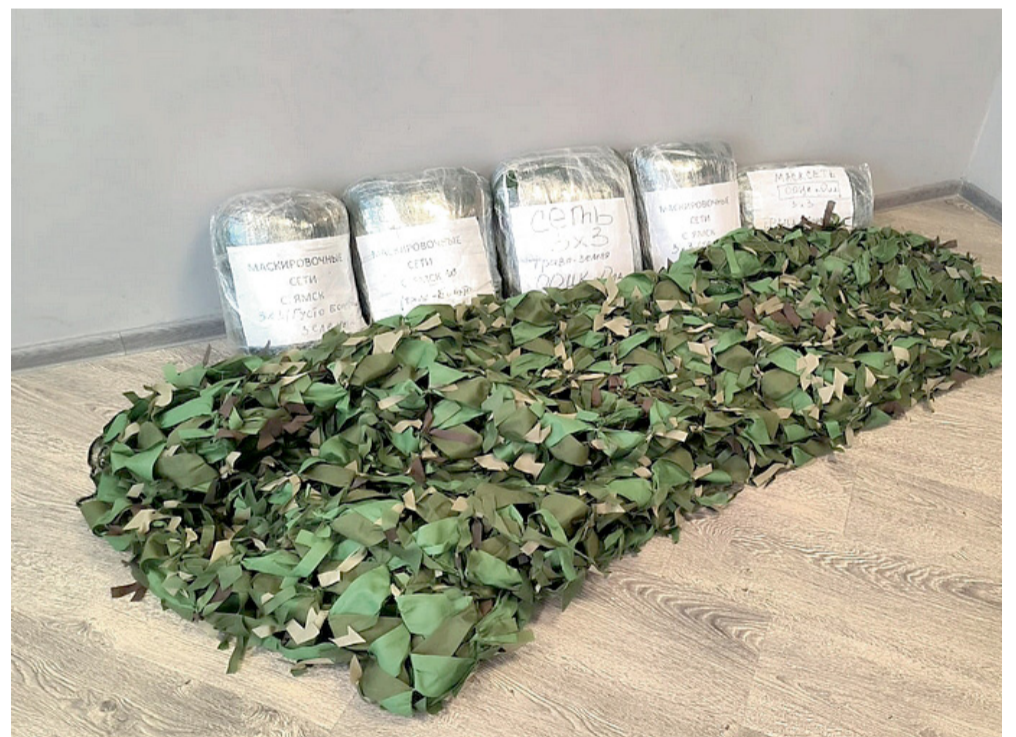
Группа волонтеров Ольского муниципального округа.

Позже груз доставят в ДНР. Задача волонтеров – привезти посылки лично в руки нашим бойцам.