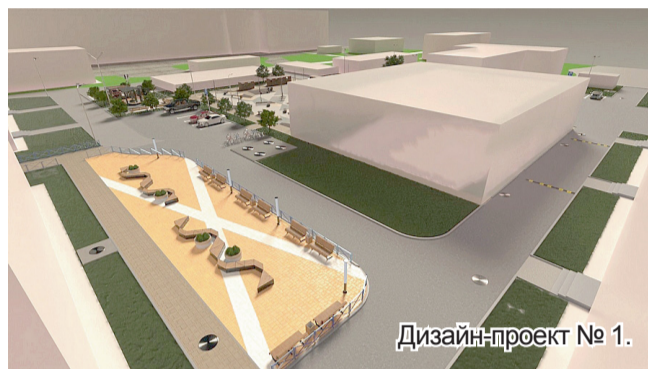
Дизайн-проект № 1.