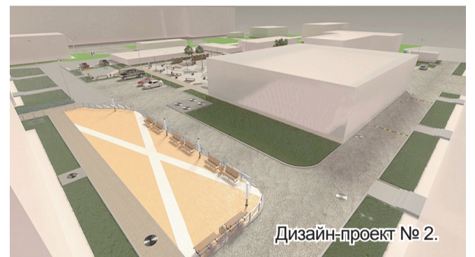
Дизайн-проект № 2.

15 марта 2024 года стартовало Всероссийское голосование по выбору объектов благоустройства по федеральному проекту «Формирование комфортной городской среды» в рамках национального проекта «Жилье и городская среда».