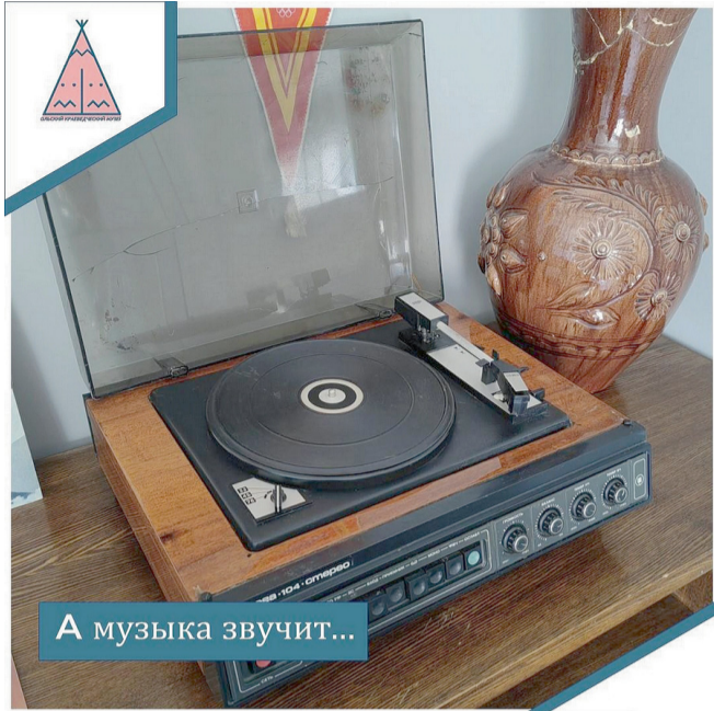
А музыка звучит...

Музыкальные инструменты являются неотъемлемой частью нашей культуры и жизни. Они позволяют нам наслаждаться мелодиями, которые проникают в самые глубины души и дарят неповторимые эмоции. В этом материале мы поговорим о четырех интересных и разнообразных музыкальных инструментах: проигрывателях, гармонии, пианино и бубне.