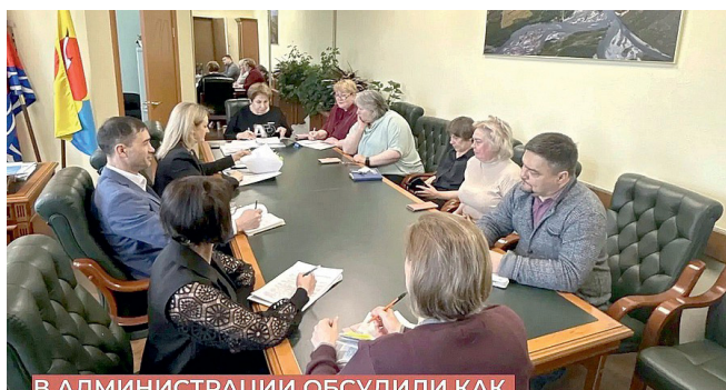
В АДМИНИСТРАЦИИ ОБСУДИЛИ КАК