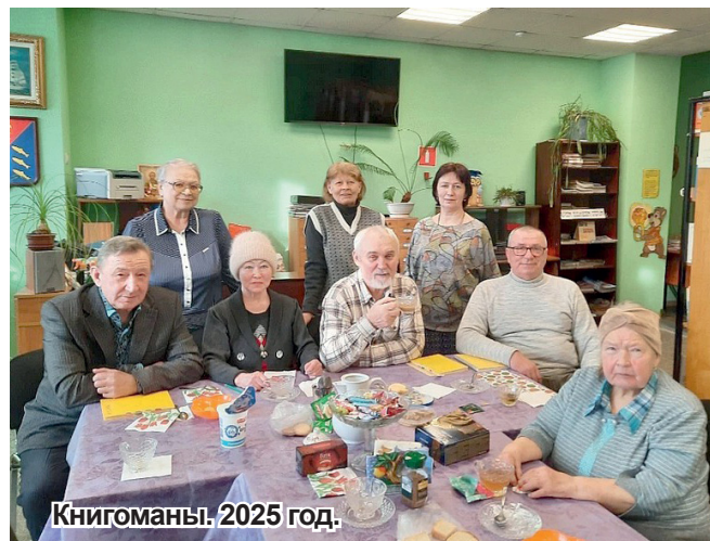
Книгоманы. 2025 год.