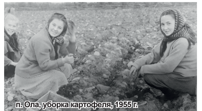
п. Ола, уборка картофеля, 1955 г.