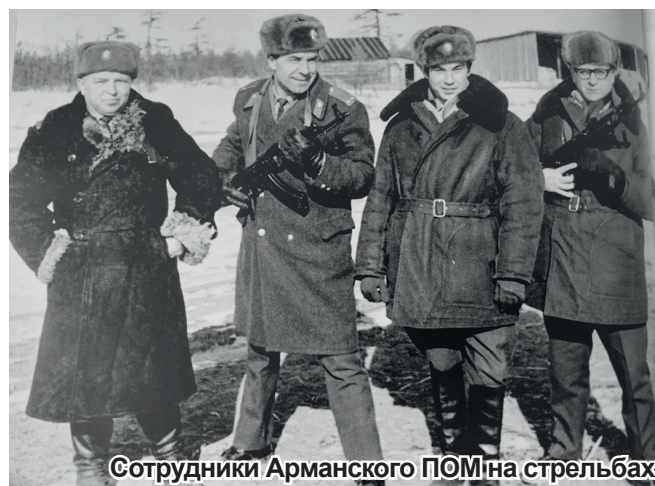
Сотрудники Арманского ПОМ на стрельбах.