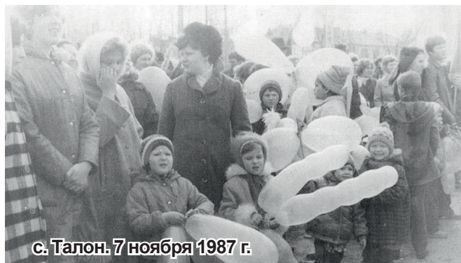
с. Талон. 7 ноября 1987 г.