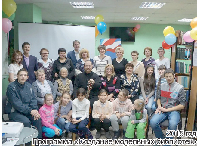
2015 год. Программа «Создание модельных библиотек».

- Земфира Геннадьевна, расскажите, пожалуйста, о себе.