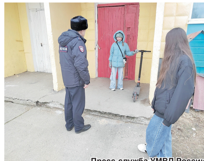
Пресс-служба УМВД России по Магаданской области. Фото из архива пресс-службы УМВД России по Магаданской области.