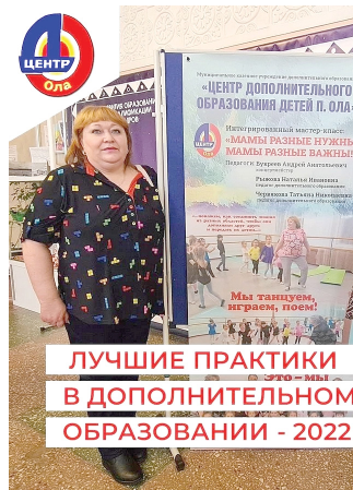
ЛУЧШИЕ ПРАКТИКИ В ДОПОЛНИТЕЛЬНОМ ОБРАЗОВАНИИ - 2022

Педагогическая династия это не только призвание, не только профессия, это имя, Имидж семьи, ее знамя. Быть похожим на родителей значит взять от них все самое ценное, развивать, улучшать, совершенствовать и приумножать этот багаж, передавать его своим детям. Люди, связанные родственными отношениями, выбирают один и тот же путь. Что это — гены, «зов крови», дар учить, переданный по наследству? Или нечто, полученное свыше, определяющее судьбу? Это явление уникальное и драгоценное, порой просто необъяснимое. К большому сожалению, оно мало освещается в печати: не каждый педагог напишет сам о себе, далеко не каждого журналиста заинтересует эта тема.