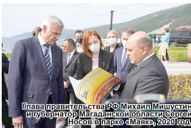
Глава правительства РФ Михаил Мишустин и губернатор Магаданской области Сергей Носов в парке «Маяк», 2020 год.

После завершения третьей очереди работы продолжатся, об этом напомнил в своем телеграм-канале губернатор региона Сергей Носов: «Пространство благоустройства четвертой очереди на месте снесённой мазутной котельной будет насыщено функциональными площадками с учётом интересов детей, молодежи, взрослых и пожилых людей. Благодаря совместной работе с инвестором здесь появится водопад с фонтаном. Также по просьбе автомобилистов мы расширим парковочные зоны. На этом работы не остановятся. По программе «Генеральная уборка» мы продолжаем очищать нашу бухту Нагаева от затонувших судов. Совместно с Министерством по развитию Дальнего Востока и Арктики идёт работа над созданием Морского туристического центра».