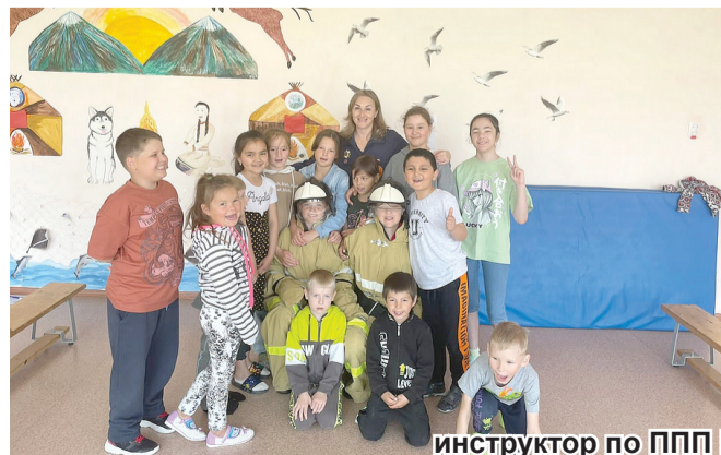
инструктор по ППП ПЧ-9 (по охране п. Ола) ОГПС по Ольскому району.

В завершение интересного мероприятия подвели итоги игры и сделали общие фотографии.