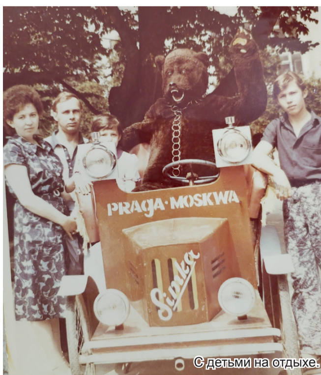
○ С детьми на отдыхе.