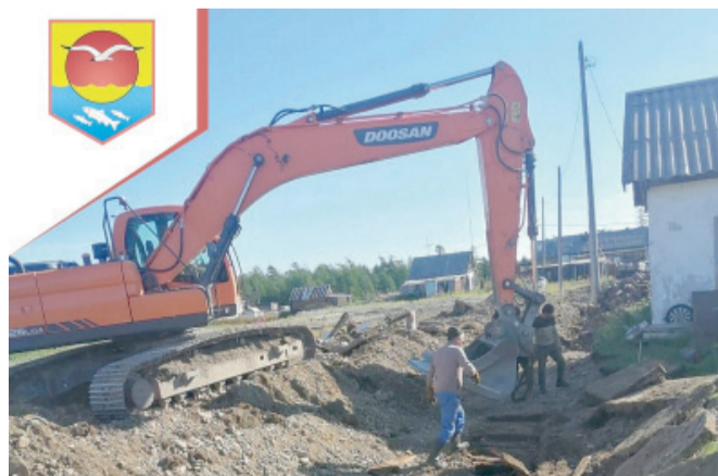
Администрация Ольского муниципального округа.

Мы благодарим жителей и сотрудников предприятий за активное участие в развитии села.