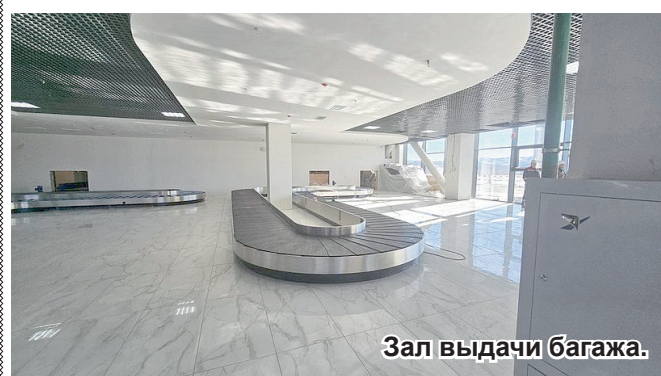
Зал выдачи багажа.