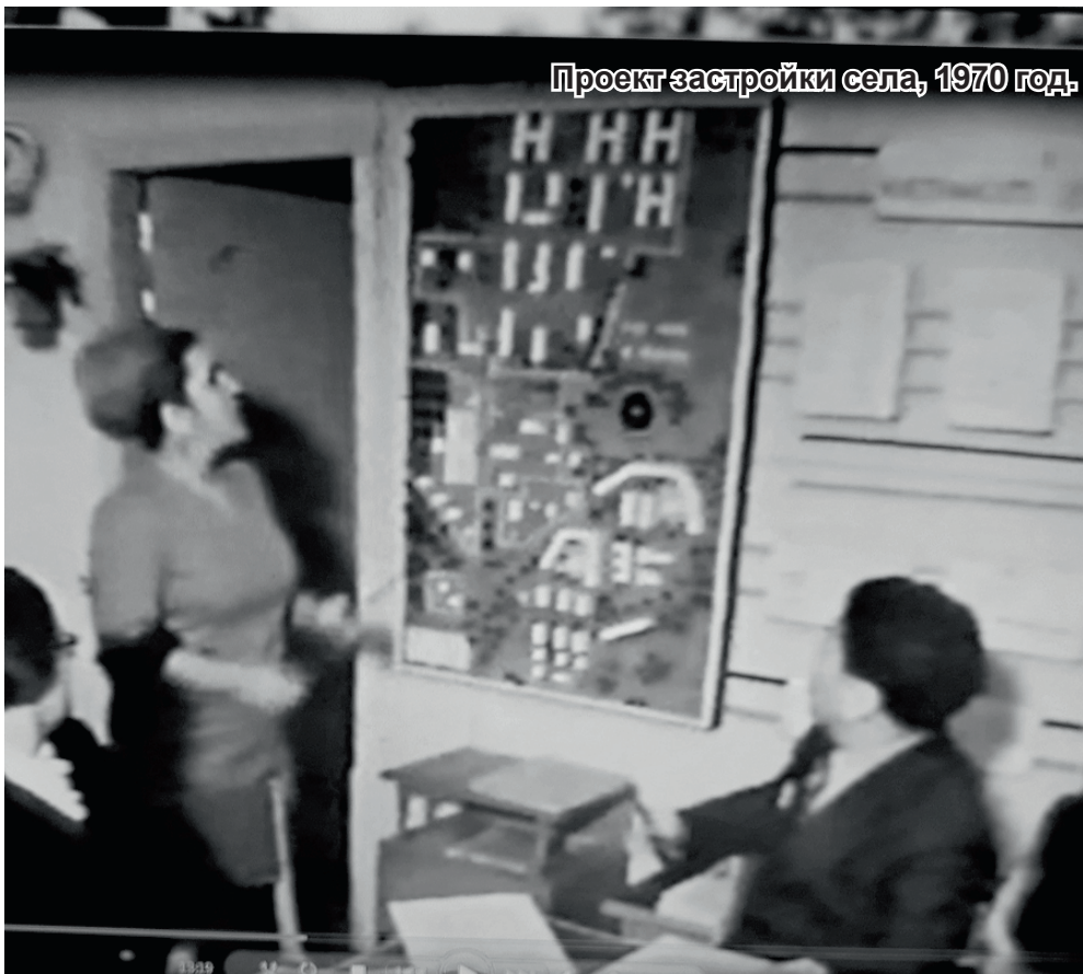
Проект застройки села, 1970 год.

На 1 января 1955 года население Клёпки составляло 104 человека, 1957 г. -