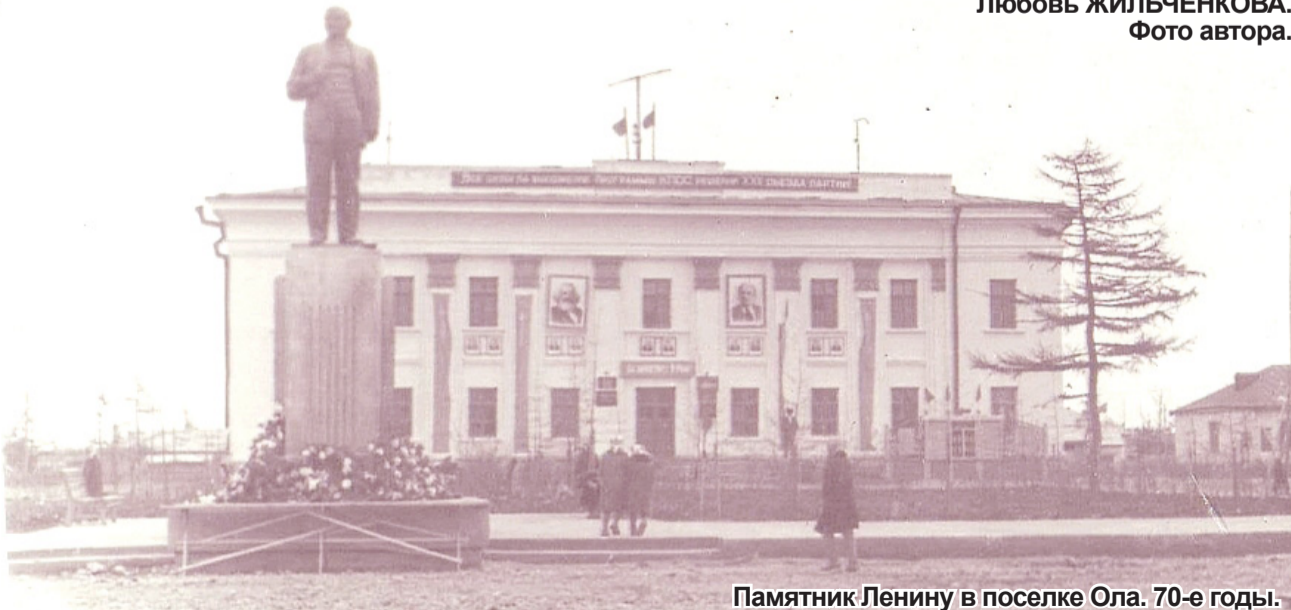
Памятник Ленину в поселке Ола. 70-е годы.