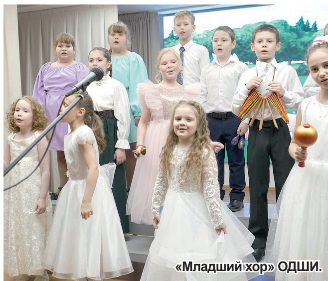
«Младший хор» ОДШИ.

Школа по праву может гордиться успехами своих учеников. Они в полной мере задействованы в творческой жизни района, области и страны. Выводят ребят на орбиту успеха их талантливые преподаватели и наставники.