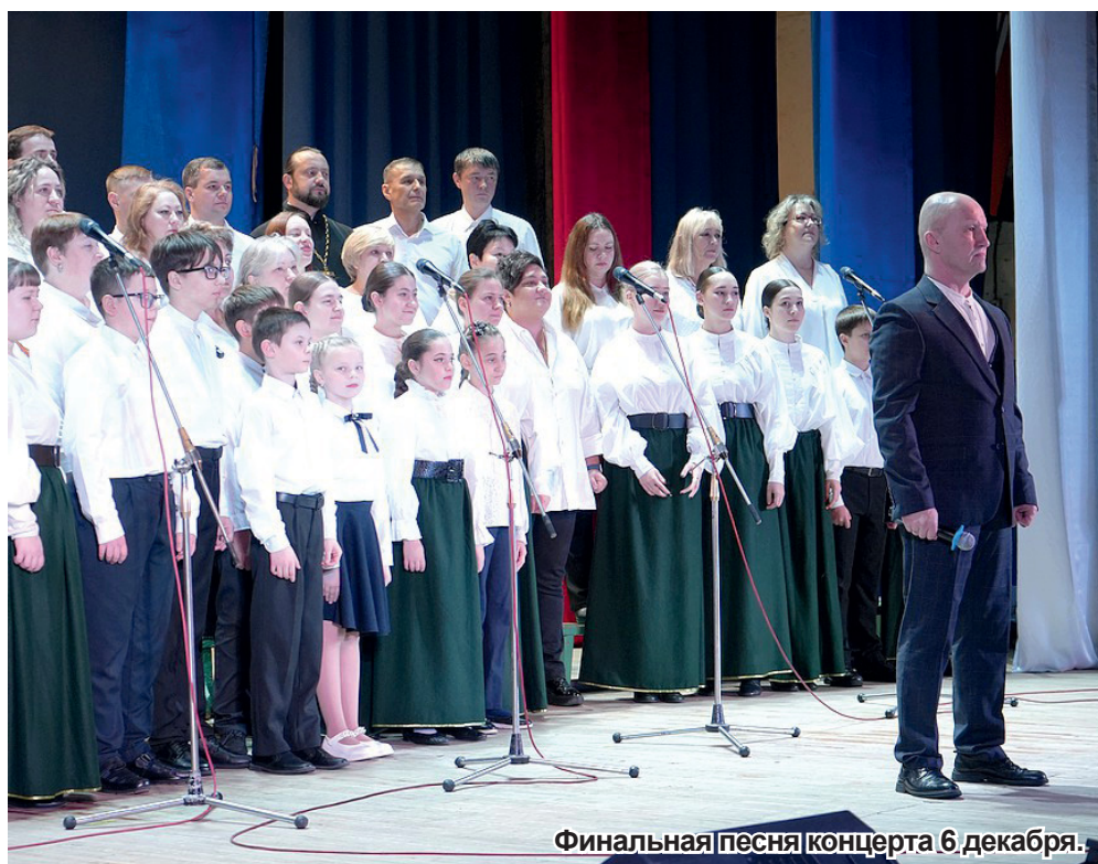
Финальная песня концерта 6 декабря.