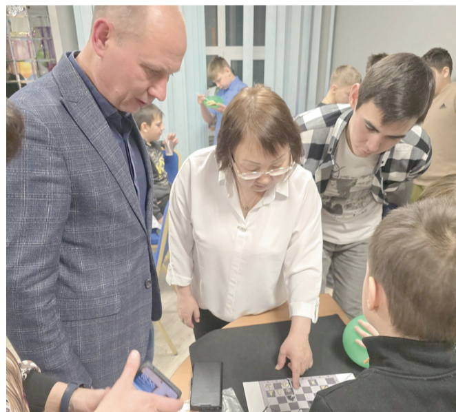
Фото из архива шахматного клуба.